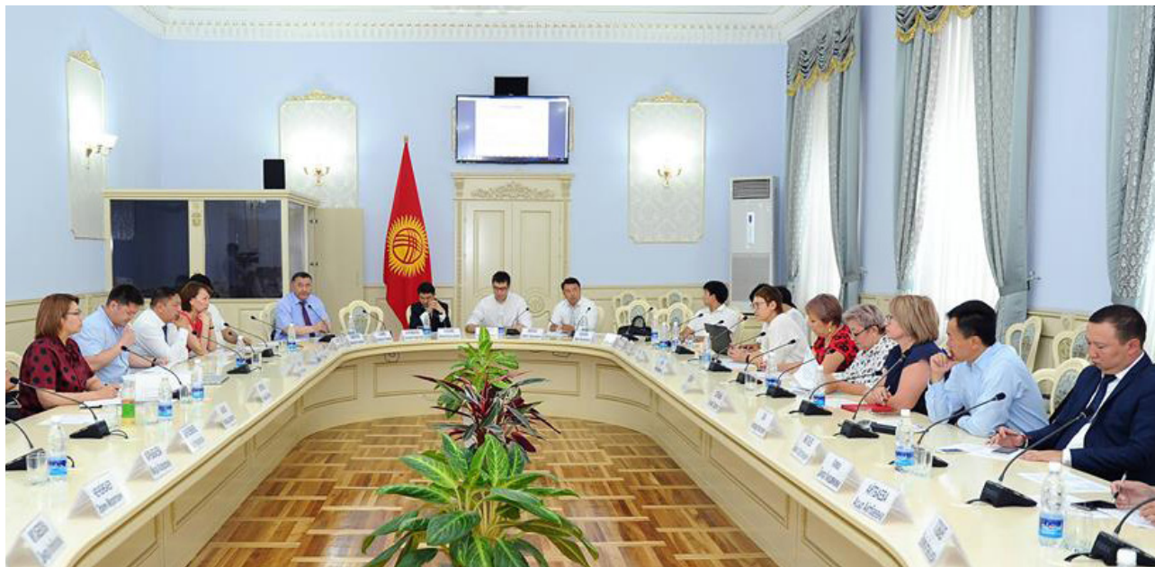
Фото 1. Третье заседание Национального Форума Открытого Правительства

По результатам 4-х заседаний Национального Форума за июнь-июль 2018 года было одобрено 18 обязательств для включения в НПД.